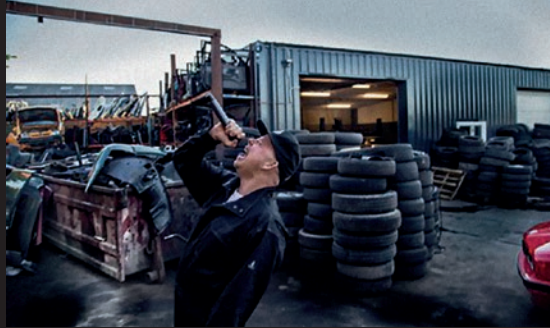
Weekend 3: Sted: Diyar Auto

Terpsichore møder Kitt Johnson fra X-act for at få en snak om, hvad MELLEMRUM egentlig er for en størrelse. Hvor slutter et rum, og hvor starter det næste?