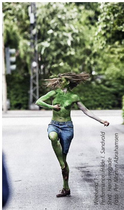
Weekend 1: Performance: Hilde I. Sandvold Sted: Hørdumsvej

"Forarbejdet handler i virkeligheden om at skabe platforme for dialog og møder kulturer og subkulturer imellem.