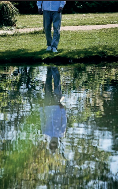
Weekend 2: Performance: Edhem Jesenkovic Sted: Tudsemindevej