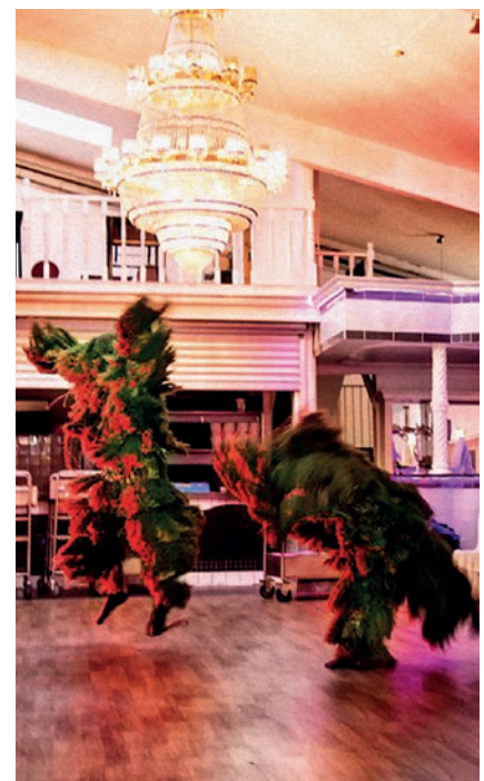
Weekend 3: Performance: The Mob Sted: Basak Saray

Det er en konstant øvelse i intuition, kommunikation og menneskekendskab, for det handler om at spørge sig selv: hvordan møder man andre? Og så er vi tilbage i hele tanken om territorierne, for de skabes jo af alle parter. Det er lige så meget gæsterne, der er med til at afgrænse og definere territoriet, som det er territoriets egne beboere. På den måde kan man sige, at rummet er flygtigt – et plastisk rum i konstant transformation."